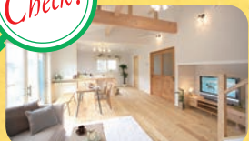
光と風で満たされたLDK

夏は風が吹き抜け涼しく、冬は日光でぽかぽか暖かいLDK。とても居心地のいい空間です。