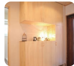
飾り棚付きのシューズラック

「ここに棚あったら便利だね」「リビングの扉はちょっといいものを」そんなふとした一言から実現したアイデア。